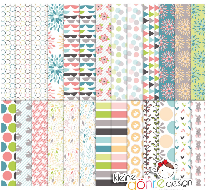
digitale Papiere "Halo Frühling Muster 2"