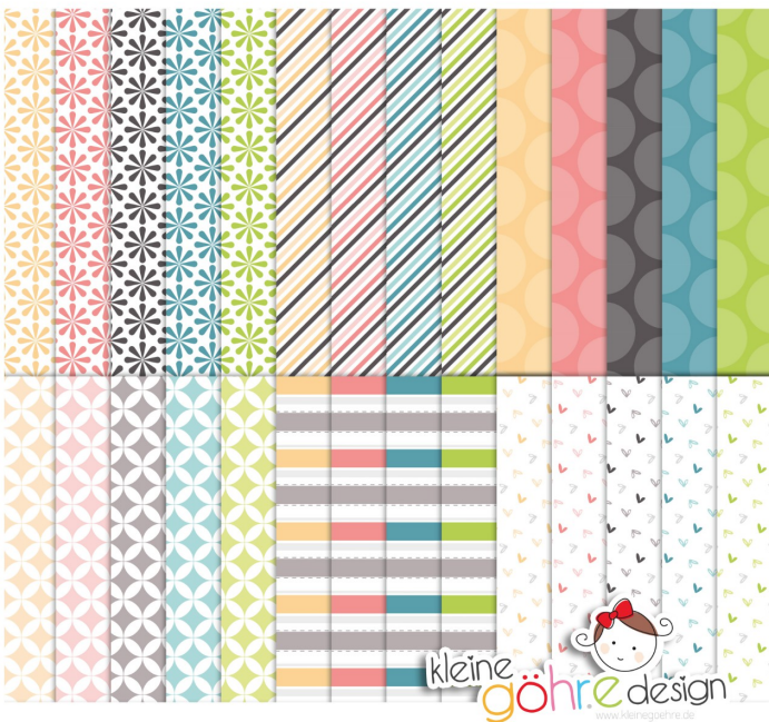
digitale Papiere "Halo Frühling Basic 1"