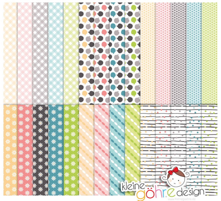
digitale Papiere "Halo Frühling Basic 2"